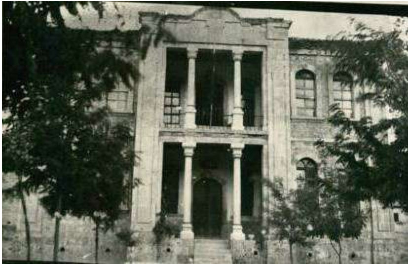
Tarihi Eski Askerlik Şubesi

Tarihi Osmanlı Çeşmesi: Osmanlı döneminde 1882 yılında yapılmıştır. Bozkır merkezde bulunan çeşme Zamanla binalar arasında kalmış ve 2017 yılında restore edilerek Anıt meydanına taşınmıştır.