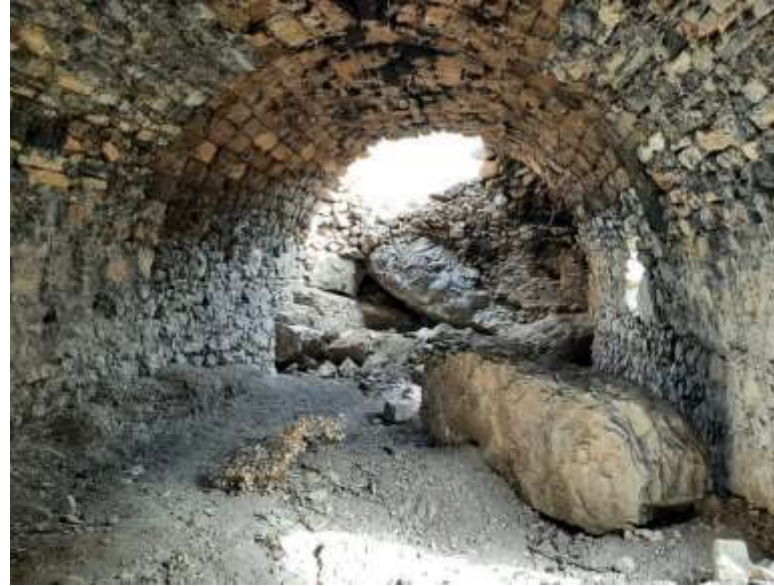
Derehan İç görüntüleri