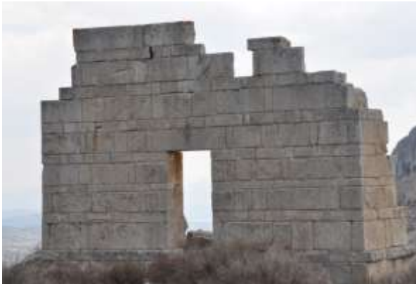
Kenti ve kapıyı korumak için yapılan kulelerden biri.