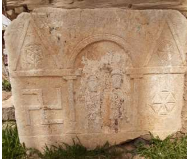
Hamzalar Mahallesi ev duvarında bulunan Mezar steli örneği Apdal Damın'dan getirilmiştir. Kireç taşındandır.