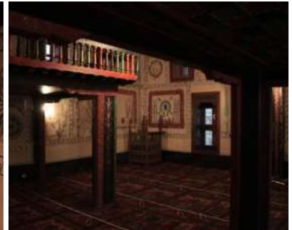
Hisarlık (Asarlık) Selçuklu cami görüntüler