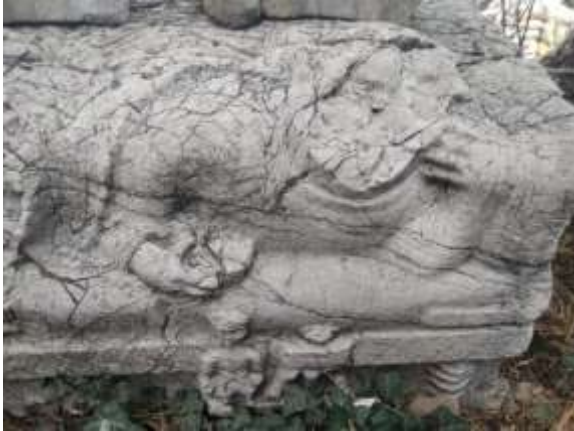
Ostothek (mezar lahit) kapağı

Dibektaş yaylasından gelmiştir kireç taşından yapılmıştır.