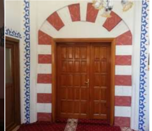
Harmanpınar camisinin içinden görüntüler.