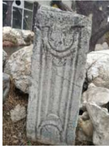
Mezar Steli (Mezar Taşı)