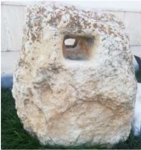
Bozkır belediye bahçesindeki

Bozkır merkezde ve mahallelerinde eski yapılara çok rastlanmaktadır .Bir çoğu yıkılmış ve bakımsızlıktan günümüze kadar gelememiştir.