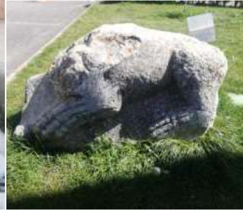
Bozkır belediye bahçesindeki

Aslan Ostohek , mezar lahit kapağı (Roma Dönemi) Yandan ve önden görünümü