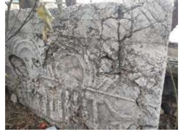
Mezar Steli ( Mezar Taşı)