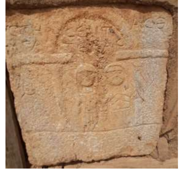
Hamzalar Mahallesi ev duvarında bulunan Mezar steli örneği.