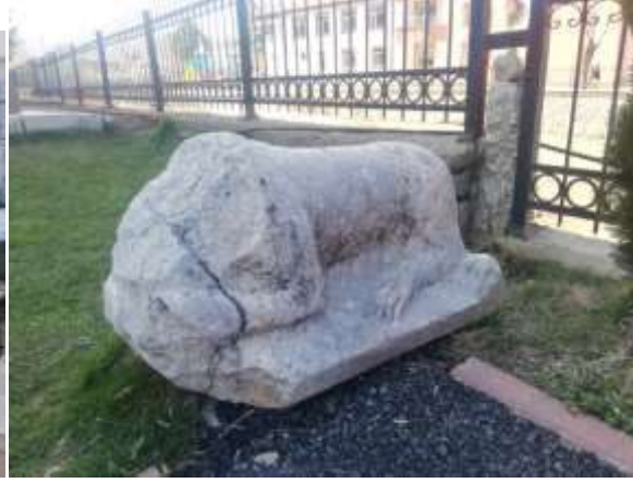
Bozkır Belediye Bahçesindeki