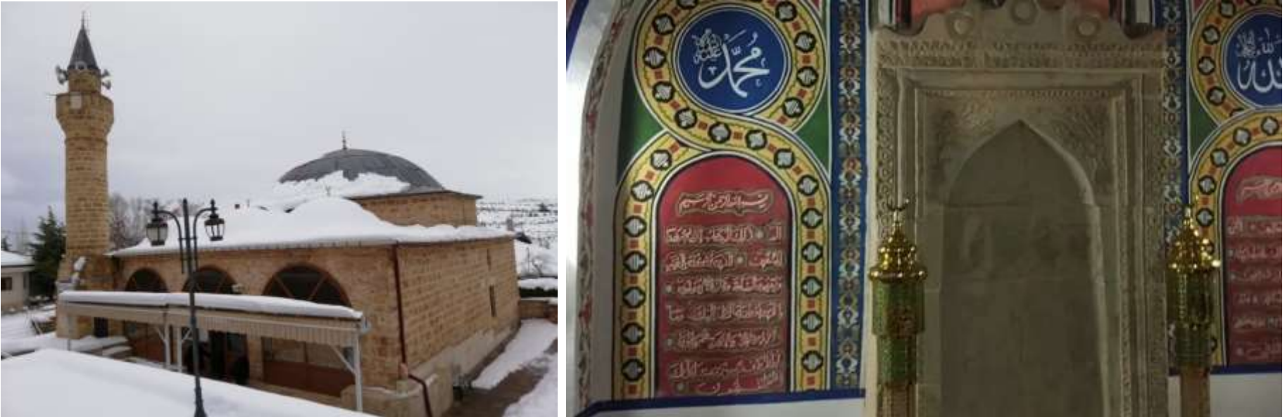
Kurşunlu cami dış ve iç görünüm

Osmanlı eseridir.17. yy. eseri olduğu tahmin edilmektedir.1816 yılında inşa edilmiştir. Müslüm Gökçek adlı Gaziantep'li bir hat ve tezhip sanatkârı tarafından 1946'da süslemelerin yapıldığı hatta köyde topladığı yumurtalar ile kökboyanlarını karıştırarak boya hazırladığı söylenir.