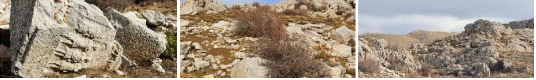
Tosuntaşı yaylasındaki kalıntılardan örnek görüntüler

Antik yerleşmedir. Toros dağlarının zirvesinde yer alır. Bir çok kabartma ve mezar stelleri (Osthotek) mezar,lahit'ler bulunmaktadır.Roma dönemine ait olan bu antik yer ,Bozkır'ın güneybatısında ve 21 km. uzaklığındadır.