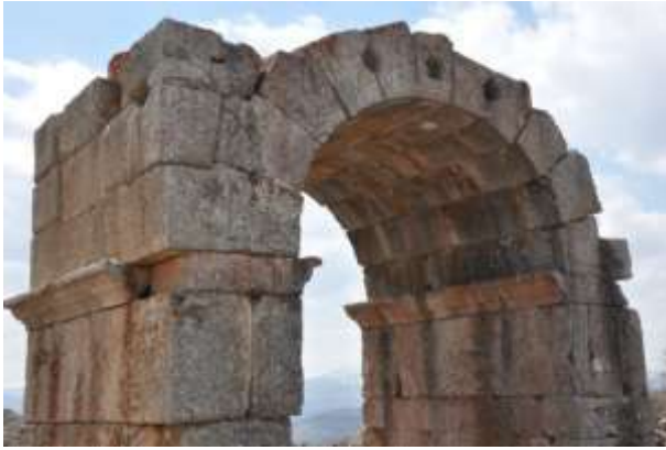
Hadrianus Zafer Taki

Not: Zengibar kalesi için ayrıca bir proje yapıldığı için burada kısa özet verilmiştir.