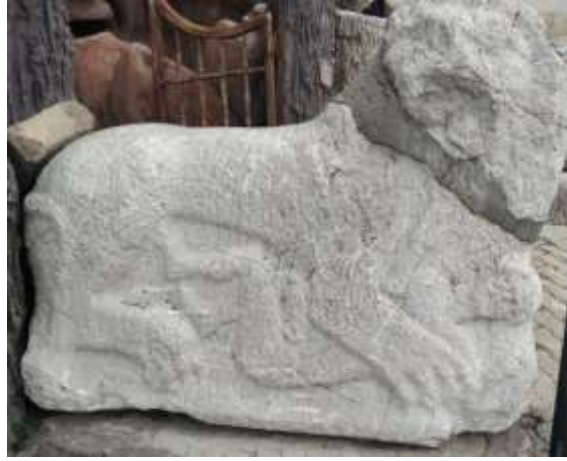
Ostothek (mezar lahit) kapağı

Dibektaş yaylasından gelmiştir kireç taşından yapılmıştır.