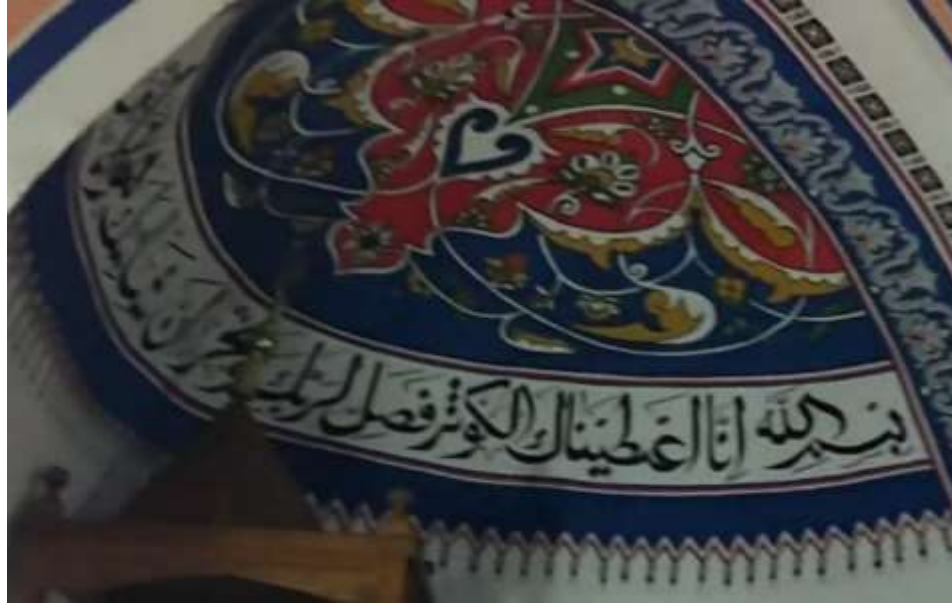
Üçpınar Kurşunlu cami iç görüntüleri