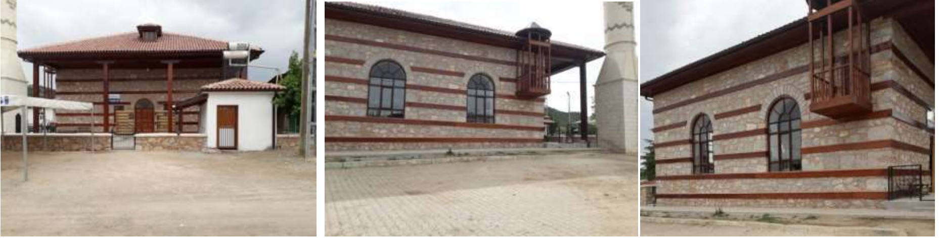
Söğüt Cami görüntüleri

Söğüt mahallesinde bulunmaktadır.Tarihi kesin olarak bilinmemekle beraber 1870 yıllarında yapıldığı rivayet edilmektedir.Zamanla restorasyona uğramıştır.