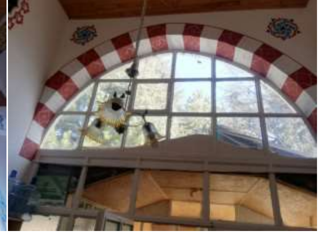
Harmanpınar camisinin içinden görüntüler.