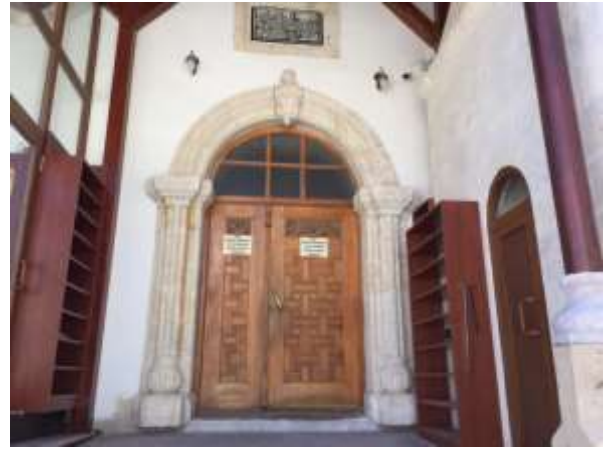
Bozkır merkez Camisinin iç görüntüleri

Not: Fotoğraflar bizzat tarihi eserlerin bulunduğu yerlere gidilerek çekilmiştir. Birkaç fotoğraf özellikle siyah beyaz eski fotoğraflar kaynak belirtilerek kataloga eklenmiştir. Bozkır ilçesinde birçok medeniyetin yaşadığını ve bunlardan kalan tarihi eserlerin çok olduğunu belirtmek gerekir. Biz ulaşabildiklerimizi kataloga almaya çalıştık. Bozkır herkesin gezip görmesi gereken tarih kokan bir yerdir.