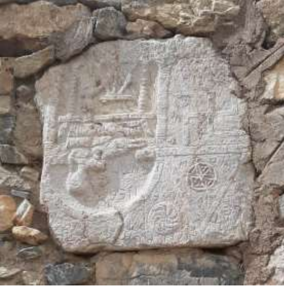
Hamzalar Mahallesi çeşmesindeki Mezar Steli örneği Terzitaşı Ören yerinden getirilmiştir. Kireç taşındandır.