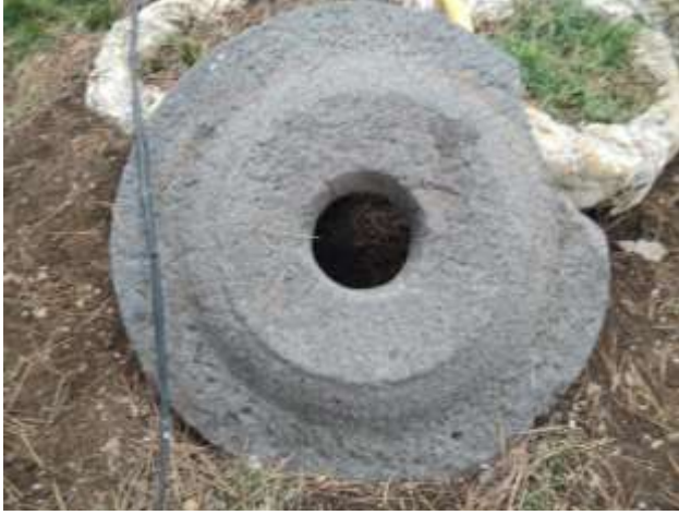
Değirmen Taşı: 20.yüzyılda çok sayıda un tahin değirmeni olarak kullanılmıştır.

M.Ö. 190 Yılları olan bu eserler Sarıot, Dikilitaş, Dibektaş yaylalarından getirilmiştir ve Roma dönemine aittir.