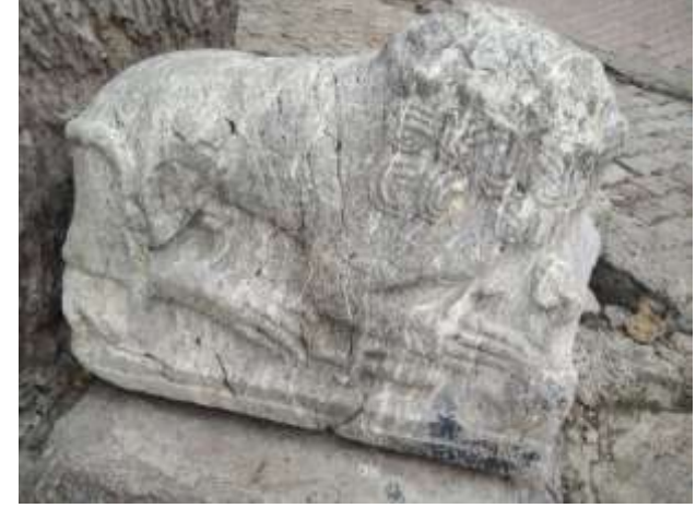
Ostothek (mezar lahit) kapağı

Dibektaş yaylasından gelmiştir kireç taşından yapılmıştır.