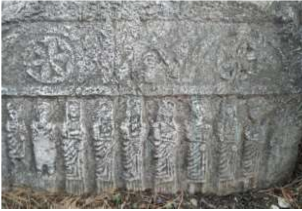
Mezar Steli ( Mezar Taşı)