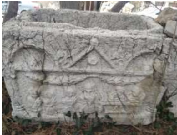
Ostothek (mezar lahit)