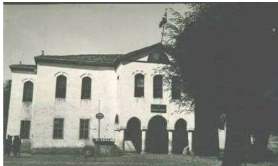
Tarihi Eski Hükümet Konağı: Eskiden anıt meydanında bulunuyormuş.

Askerlik şubesi yıkılıp yerine şimdiki hükümet konağı yapılmıştır.