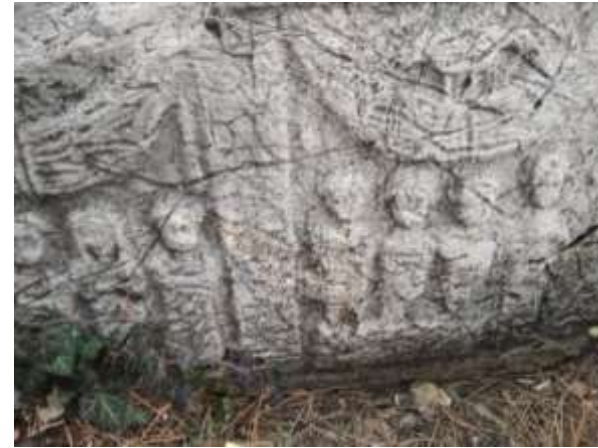
Mezar Steli (Mezar Taşı)

Roma döneminden kalma bu eserlerin benzerleri ve pek çok eser Dibektaş, Sarıot, Dikilitaş, Aslantaş, Tosuntaşı gibi bir çok yaylada bulunmaktadır.