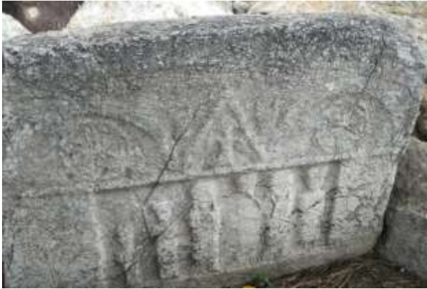
Mezar Steli (Mezar Taşı)