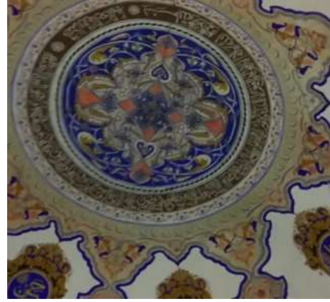
Üçpınar Kurşunlu cami iç görüntüleri