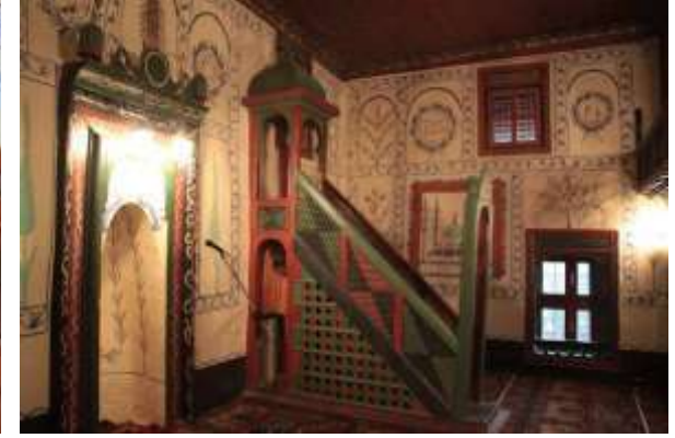
Hisarlık (Asarlık) Selçuklu cami görüntüler