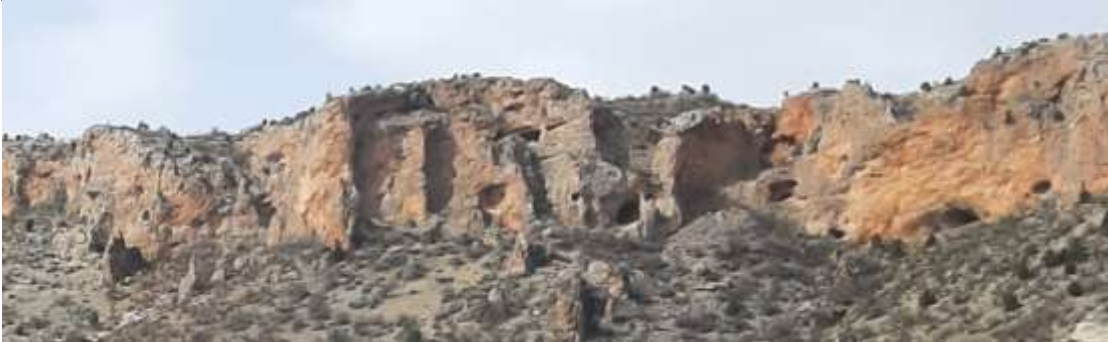
Eski değirmen yoluna giderken tepede görünen yerleşim yerleri şeklinde görünen kaya delikleri.