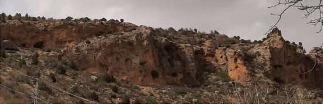
Eski değirmenin karşı üst kısımda bulunan yerleşim yerleri şeklinde görünen kaya delikleri.