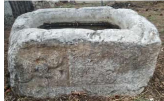
Ostothek (mezar lahit)