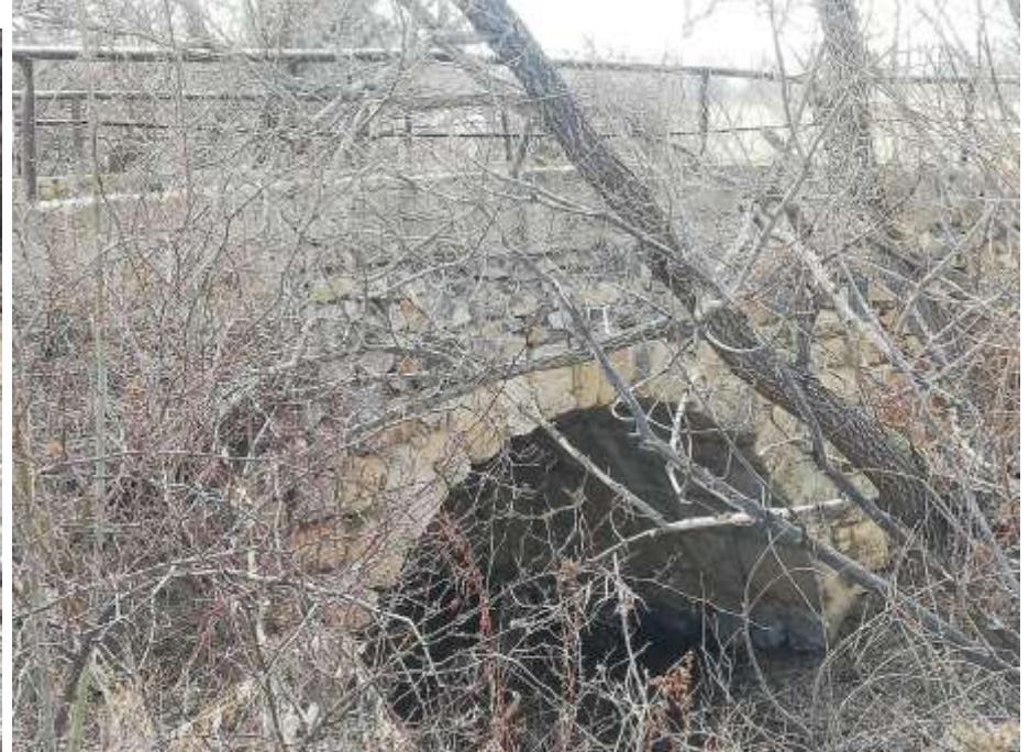
Cuma Mescidi Köprüsünün üstten ve yandan görüntüleri