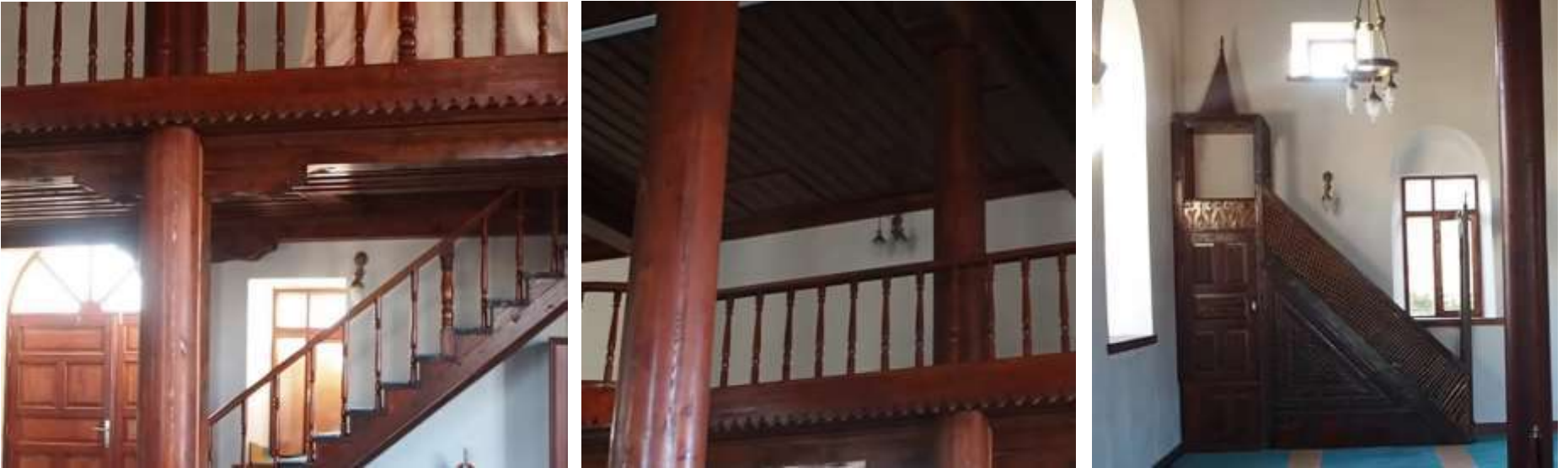
Söğüt Cami iç görüntüleri