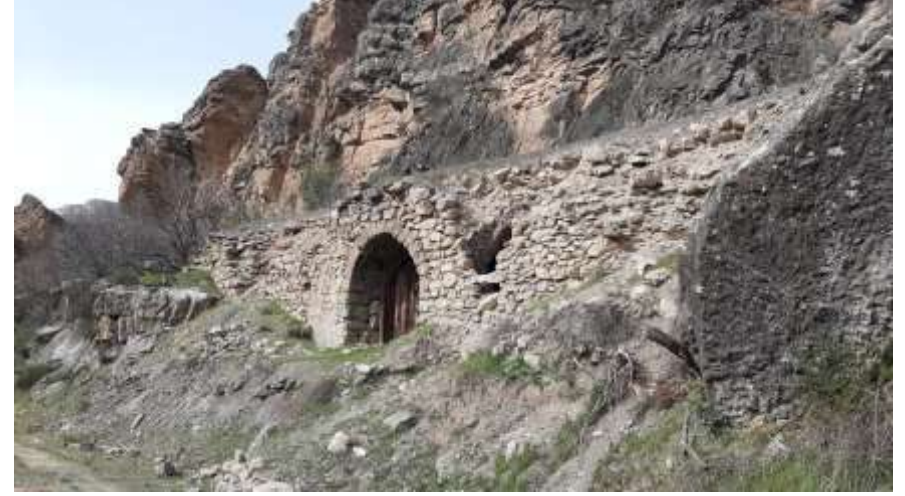
Derehan, önden ve çapraz görüntüsü