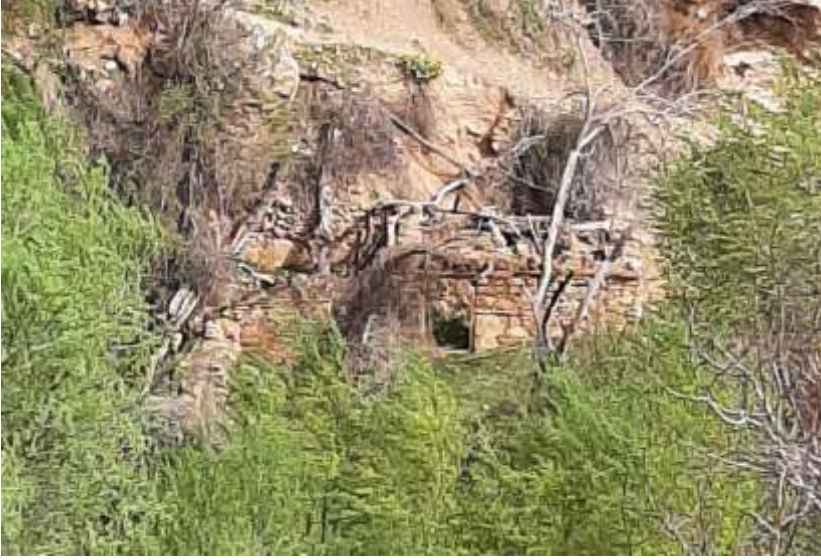
Derehan civarında bulunan eski değirmen, tarihi bilinmiyor.