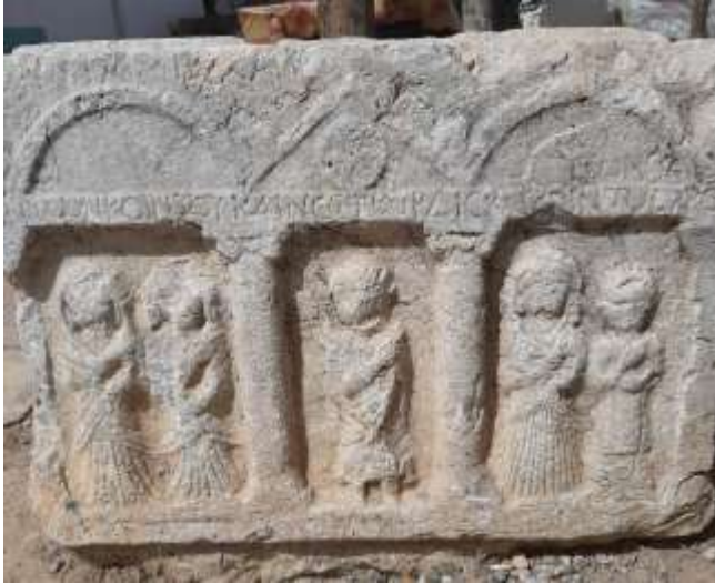
Ostothek ( mezar) Gövdesi