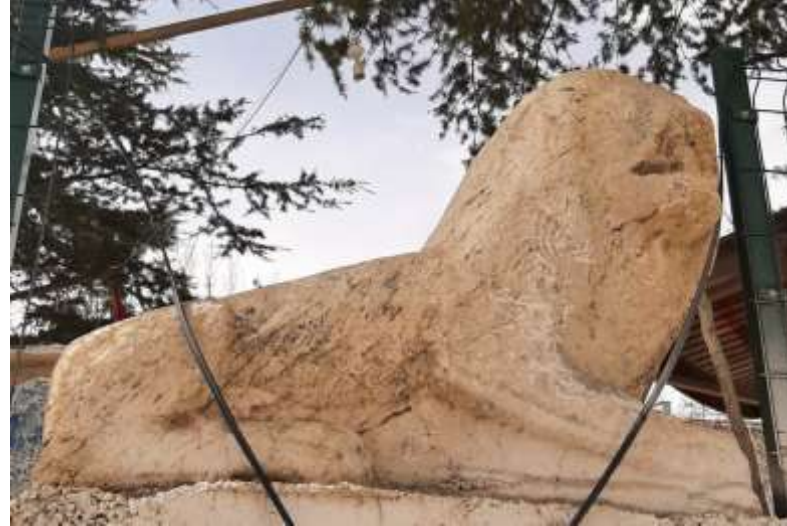
Ostothek (mezar) Kapağı