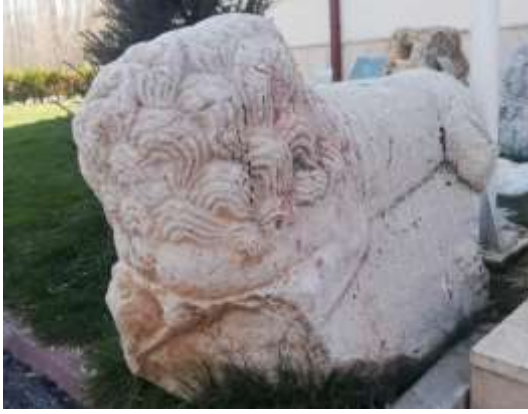
Bozkır Belediye Bahçesindeki