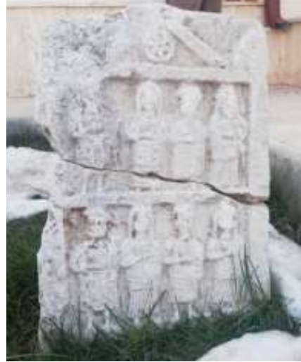
Bozkır belediye bahçesindeki