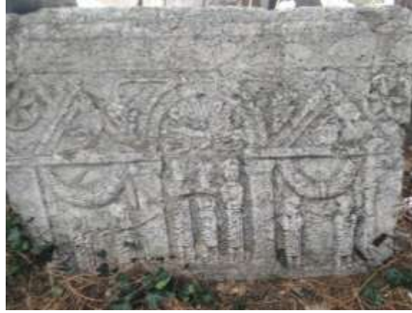
Mezar Steli (Mezar Taşı)