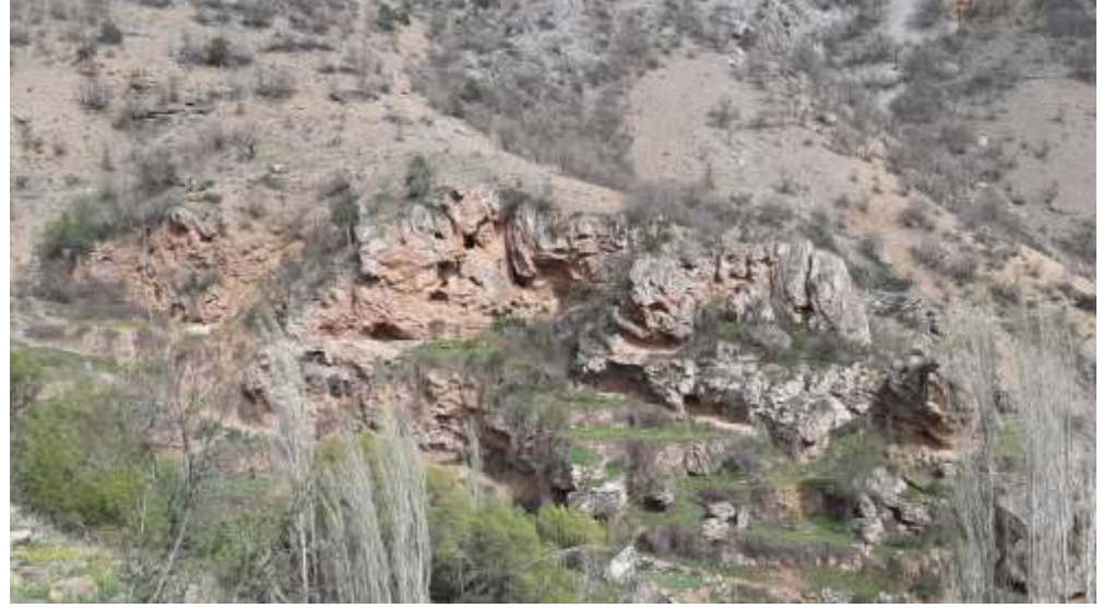
Değirmenin yanında bulunan yerleşim yerleri şeklinde görünen kaya delikleri.